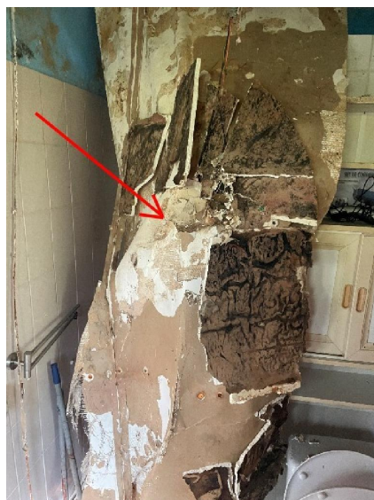
La douche est située derrière ces morceaux de plaques de plâtre ...