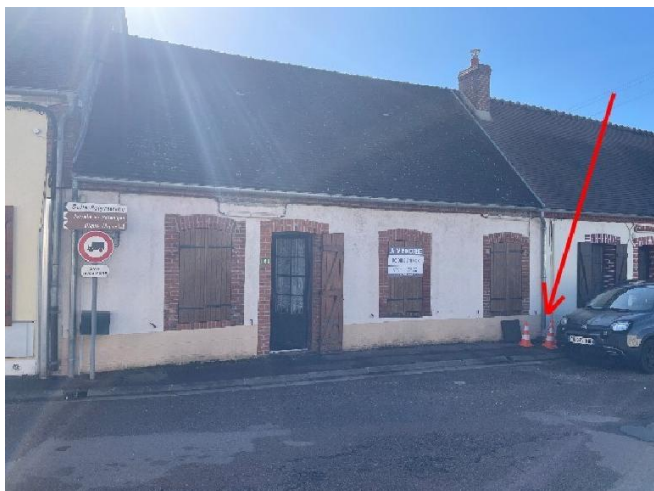
Regard Eaux Usées situé sur la voie publique.