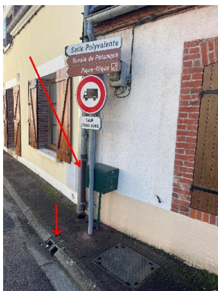
Descente de gouttière avant du bien.