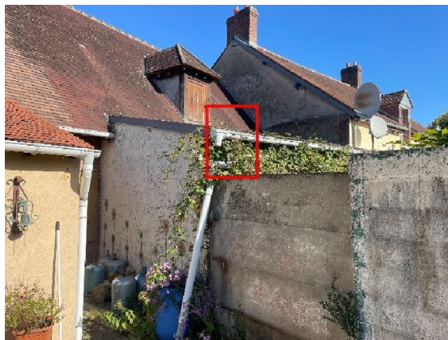
Descente de gouttière arrière du bien (sur jardin)