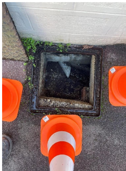
Regard Eaux Usées détail.