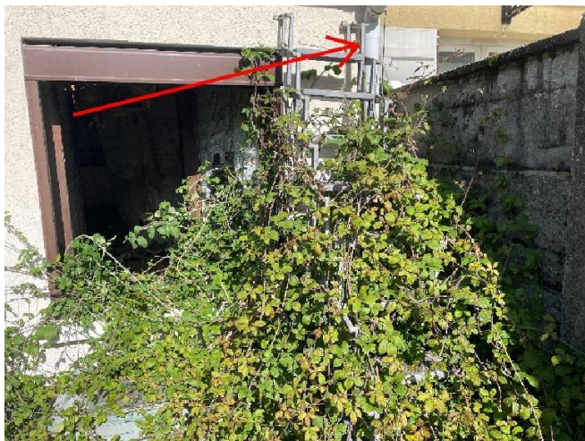
Descente de gouttière arrière du bien. (sur jardin)