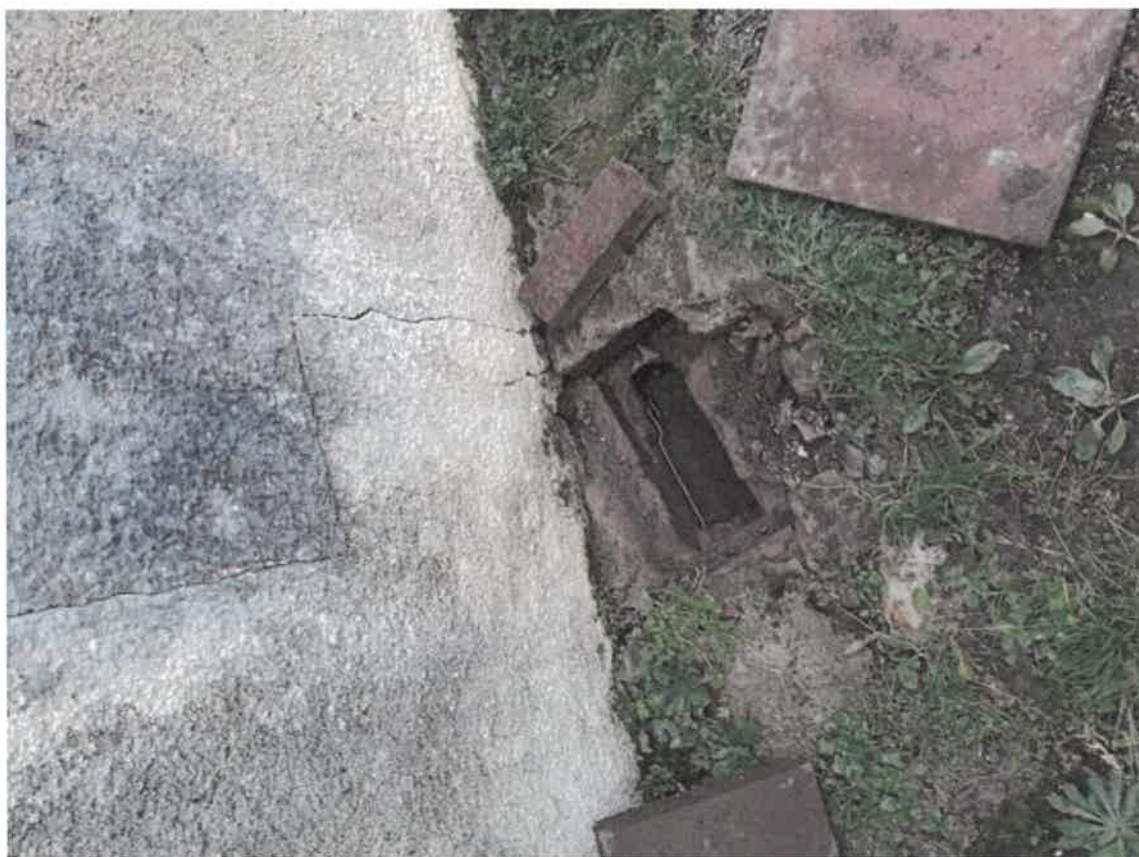
Regard de collecte des eaux usées de la cuisine